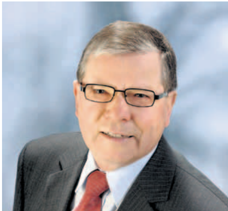
Nationalrat Werner Messmer

Unsere FDP-Parlamentarier in Bern sind für diese Problematik die zuverlässigsten. Zwei unabhängige Studien haben das bewiesen. Hunderte von Abstimmungen wurden ausgewertet. Der Schweizerische Gewerbeverband liess die Zuverlässigkeit in gewerblichen, binnenmarktorientierten Fragen untersuchen, die NZZ am Sonntag das liberale Wirtschaftsverhalten. Bei beiden Studien ist die FDP klarer Spitzenreiter und ihre Parlamentarier belegen die vordersten Positionen.