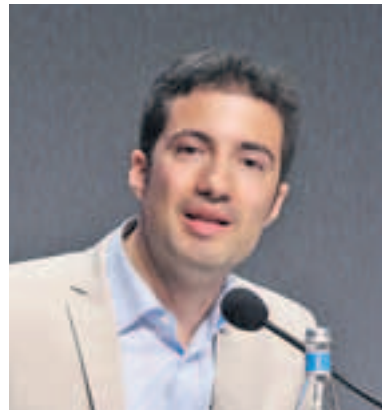
Nationalrat Andrea Caroni (FDP AR) berichtete aus Bern.

Andrea Caroni, Nationalrat FDP von Appenzell Ausserrhodon, stellte die Volksinitiative «Volkswahl des Bundesrates» vor. Die Delegierten folgten seiner Argumentation, dass eine Volkswahl des Bundesrates zu einem Dauerwahlkampf im amerikanischen Stil führen würde, der den Bundesrat als Gremium lähmen und das Parlament schwächen würde. Mit 57 NEIN und einer Enthaltung wurde die Volksinitiative klar abgelehnt.