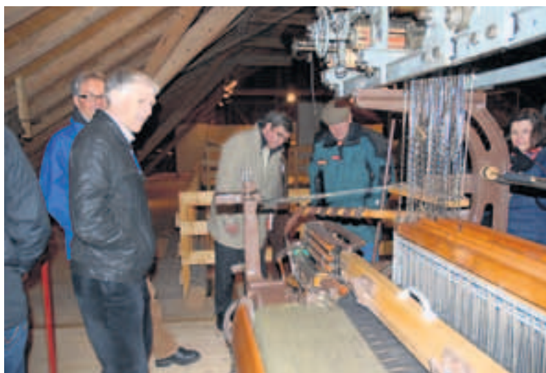
Die FDP-Mitglieder besuchten das Ortsmuseum Wängi.