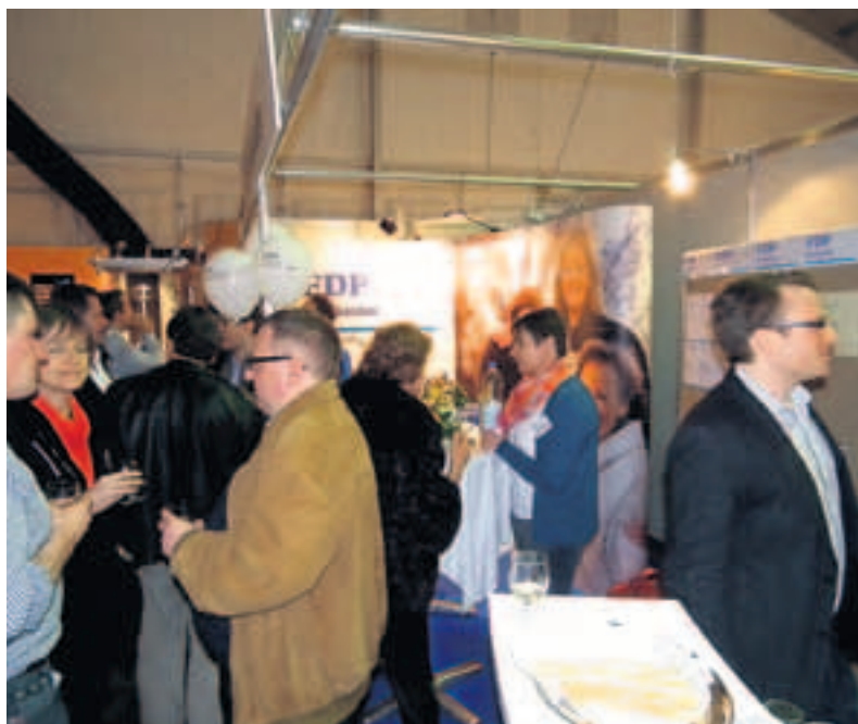
Hochbetrieb am Stand der FDP an der Frühjahrsmesse Frauenfeld.