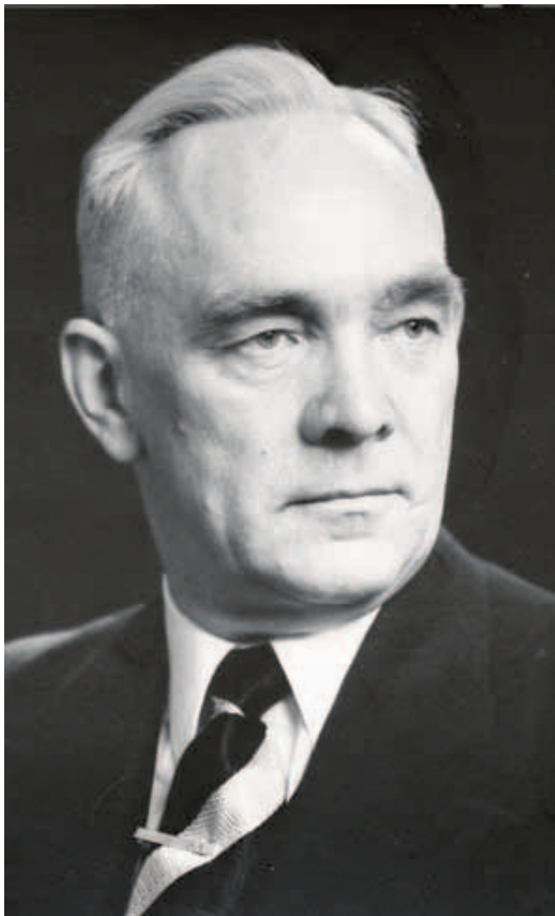
Hans Munz senior um 1970.

ESB. Am 4. März 2013 ist in Amriswil alt Ständeratspräsident Hans Munz verstorben. Während Jahrzehnten hat er die Politik der FDP Thurgau und des Kantons mitgeprägt.